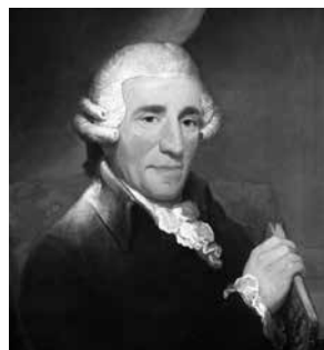
יוזף היידן (1809-1732)

הסימפוניה מפתיעה בשזירת אלמנטים בלתי סימטריים בצורה הסדורה והסימטרית ואולי זו אחת מגדולותיו האופייניות של היידן כמלחין וכאדם, שילדותו הייתה רבת תהפוכות וטלטלות, אך הוא השכיל להתהוות לאדם שופע אופטימיות וחיבה לסובביו.