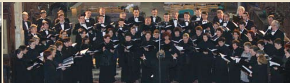
המקהלה הפילהרמונית של טרנסילוניה