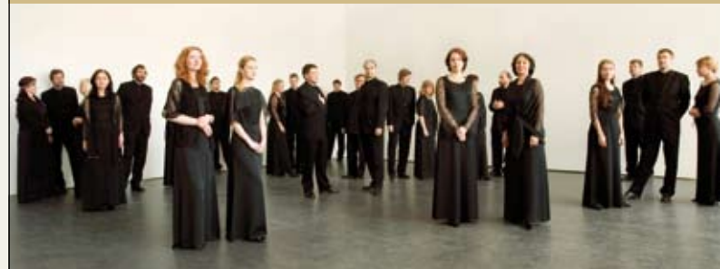
המקהלה הפילהרמונית קאמרית מאסטוניה