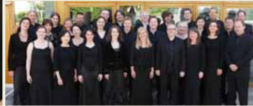
מקהלת אקדמיית השירה מציריך