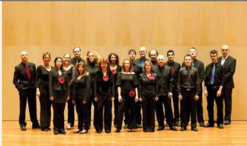
האנסמבל הקולי הישראלי