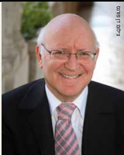
סטודיו דן סיניא