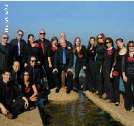
האנסמבל הקולי החדש