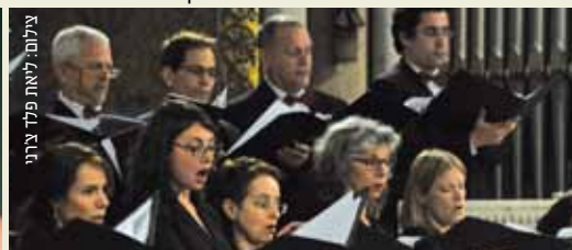
צילום: לאור פלד צרני