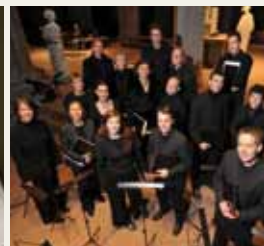
מקהלת המדריגל מבזל