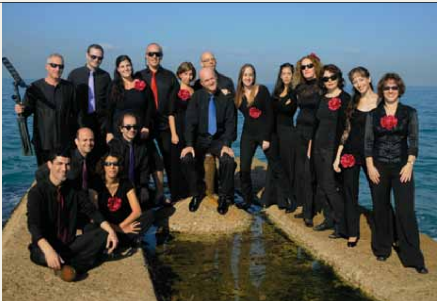
האנסמבל הקולי החדש